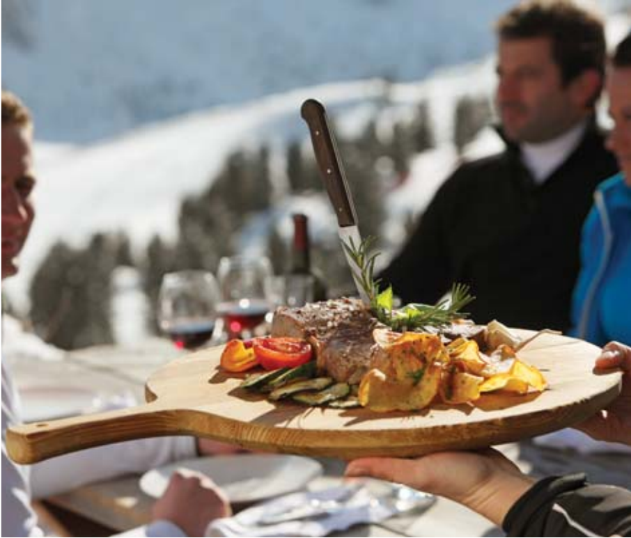
La gastronomía es primordial en las Dolomitas

con la abundancia italiana. Una oportunidad única para vivenciar lo grandioso de los Alpes. Esta misma modalidad se realiza también internacionalmente, pasando por territorios de Italia, Austria y Suiza.