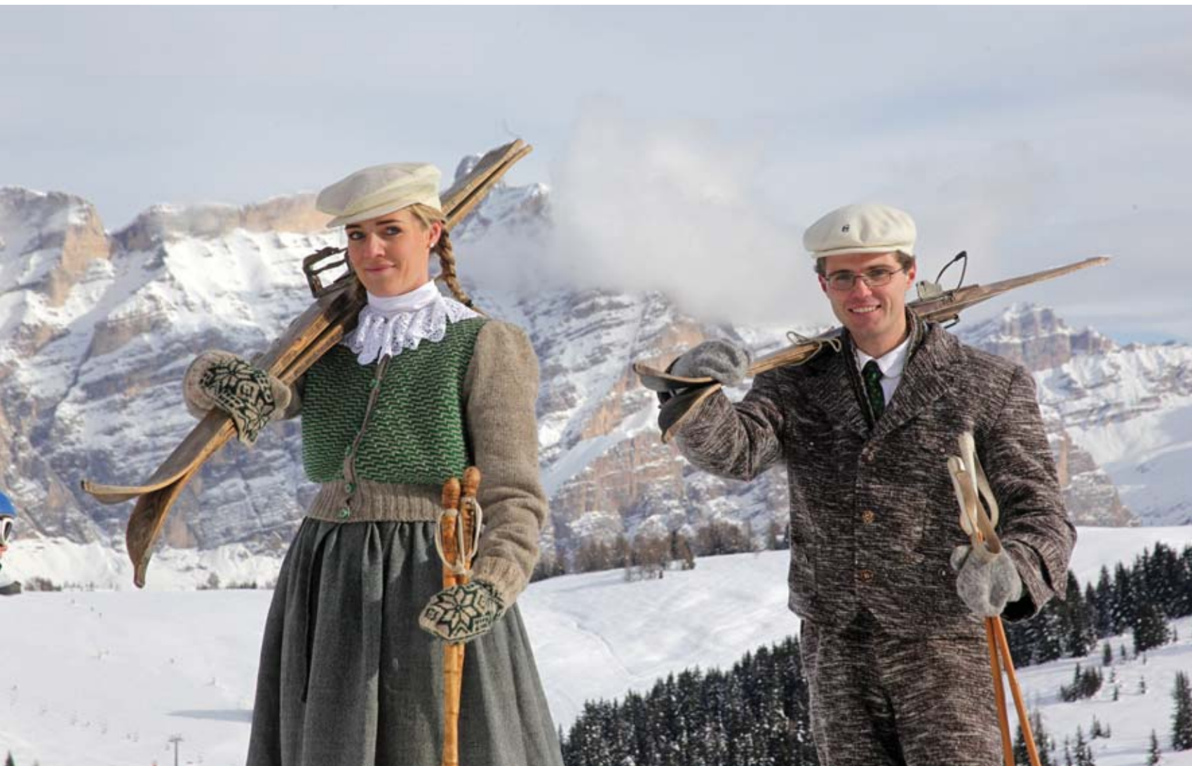
Esquiadores antiguos en las Dolomitas

Cuando en estas tierras el calor arrasa, quienes aman el frío saben que el invierno no descansa y se trasladan al hemisferio norte en busca de sus deportes favoritos: el esquí y el snowboard . Con propuestas de muy alto nivel, en hospedaje, servicio, pistas e instalaciones, los centros de esquí de Colorado e Italia se han instalado en la agenda de los esquiadores.