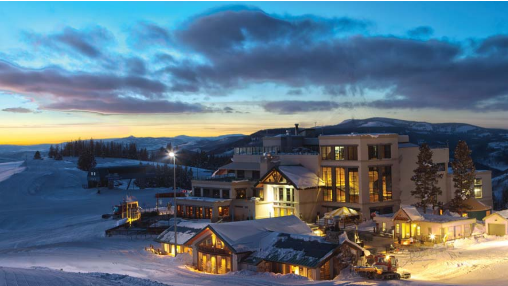
Vista de Vail Village desde la Eagle Bahn Gondola. Aquí se disfruta de restaurantes como el famoso Bistro Fourteen