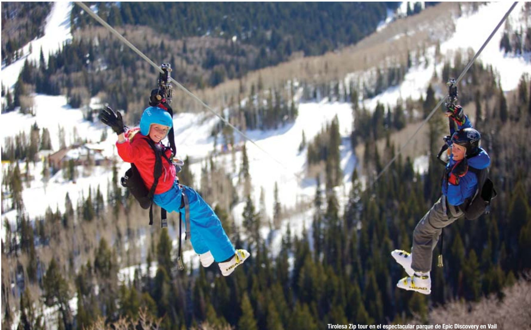
Tirolesa Zip tour en el espectacular parque de Epic Discovery en Vail