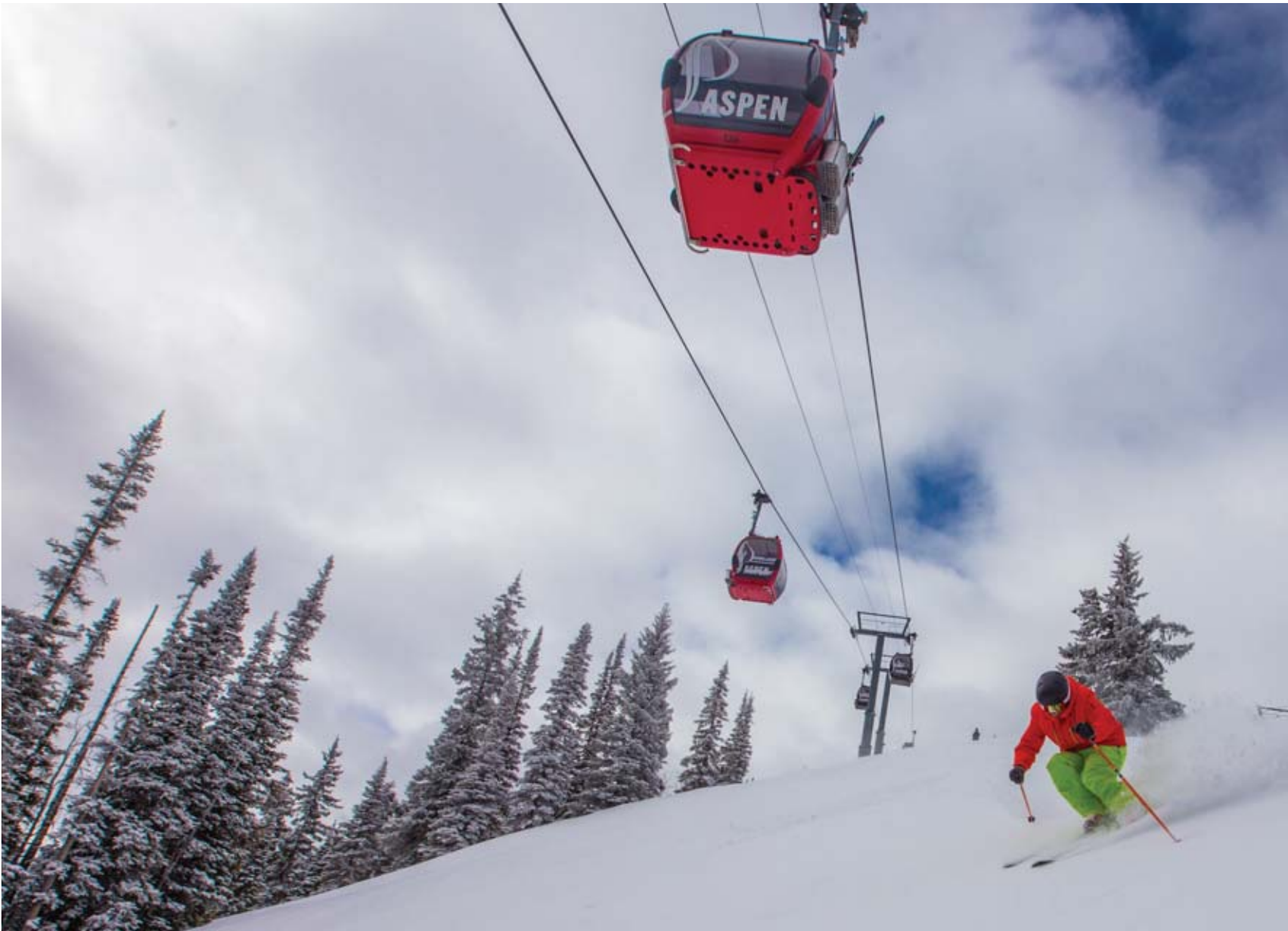
Esquí extremo en Aspen

La remodelación del restaurant Gwyn's High Alpine en la montaña de Snowmass y la apertura de un hotel Limelight en Ketchum, Idaho, casi al pie de la icónica montaña Sun Valley Ski resort son otras novedades destacadas.