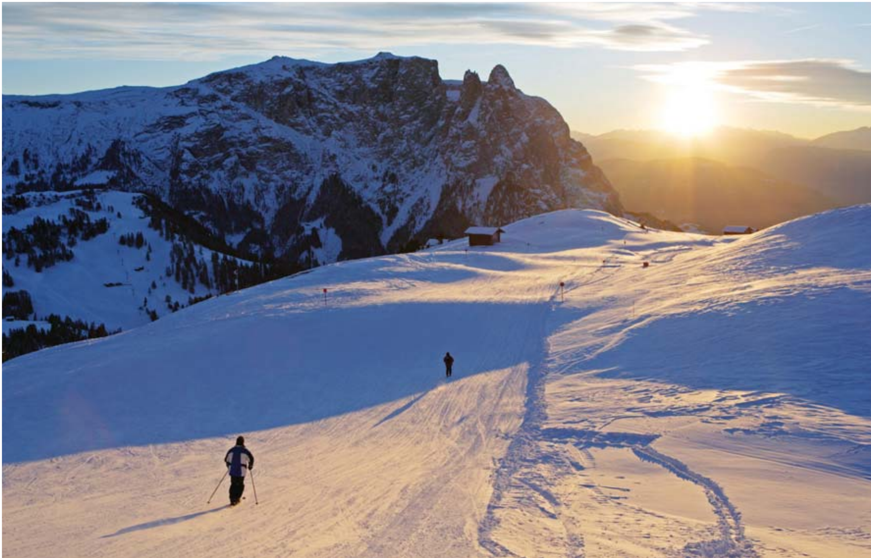
Atardecer en una de las zonas más imponentes de las Dolomitas